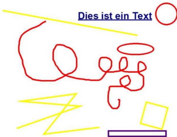
Bild 1 von 10 von Leistungsstand Fototitel: Leistungsstand Foto 1 Datum: Donnerstag, 24.09.2020 Zeichnung zum Leistungsstand