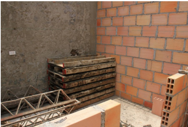
Bild 7 von 10 von Leistungsstand Fototitel: Leistungsstand Foto 7 Datum: Donnerstag, 24.09.2020 Firma: Wackelmann KG Schalung, gelagert