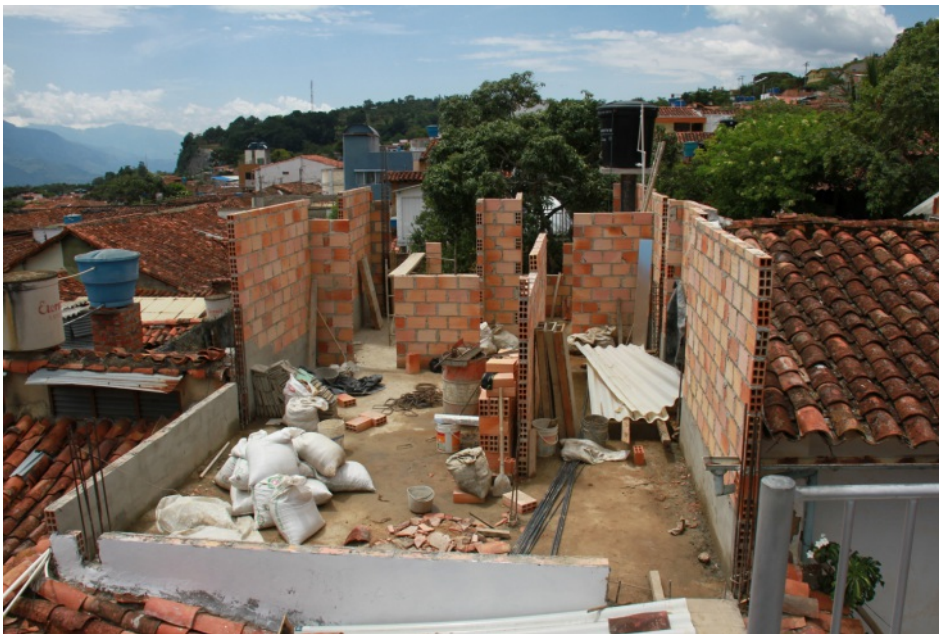
Bild 1 von 2 von Wichtige Baumaßnahmen Fototitel: Baumaßnahmen Foto 1 Datum: Montag, 24.08.2020 Firma: Stein und Bein GmbH Mauerwerksarbeiten