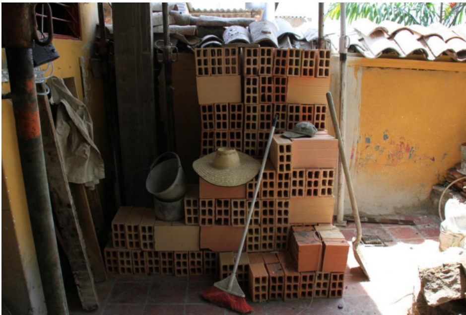
Bild 1 von 1 von Behinderungen Fototitel: Behinderungen Foto 1 Datum: Donnerstag, 24.09.2020 Firma: Stein und Bein GmbH Gelagertes Material behindert Schlosser