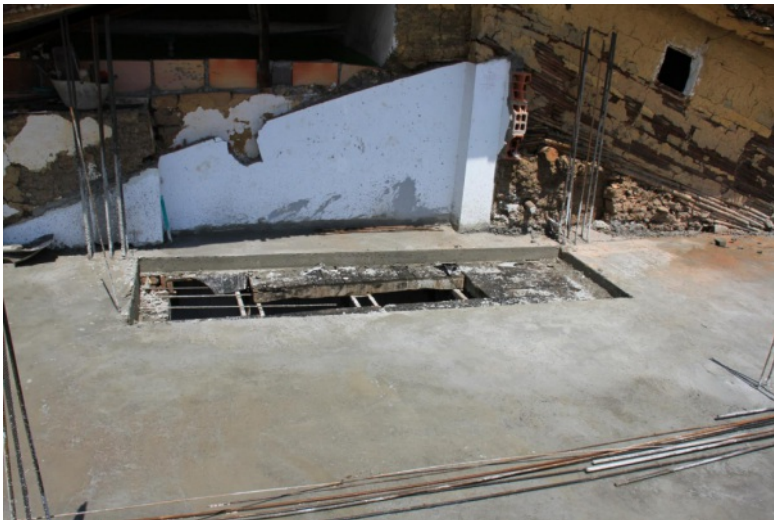
Bild 8 von 10 von Leistungsstand Fototitel: Leistungsstand Foto 8 Datum: Donnerstag, 24.09.2020 Firma: Schütt & Schal GmbH Treppenöffnung