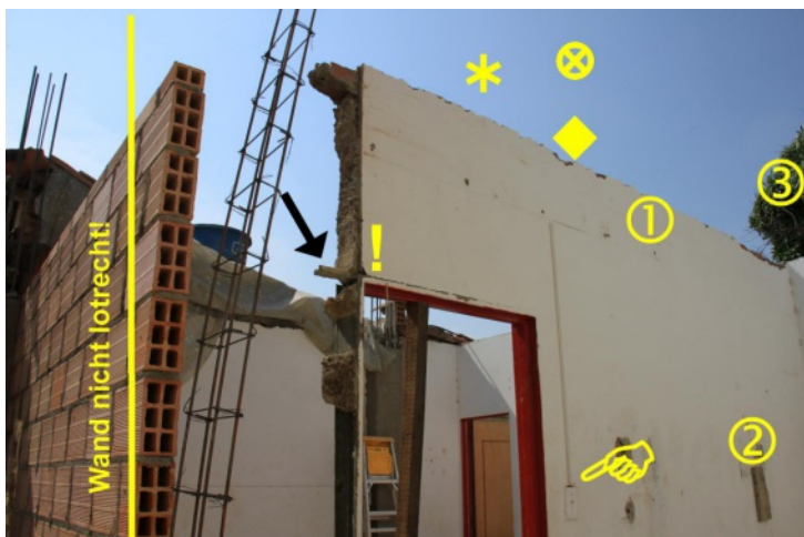
Bild 3 von 10 von Leistungsstand Fototitel: Leistungsstand Foto 3 Datum: Donnerstag, 24.09.2020 Firma: Stein und Bein GmbH Wand Kinderzimmer nicht im Lot