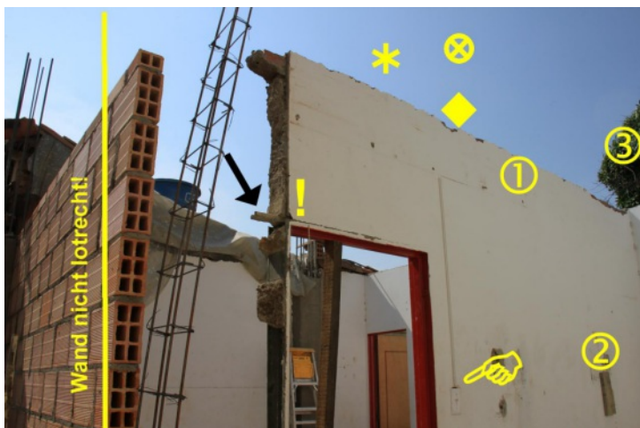
Bild 3 von 3 von Mängel Wand nicht lotrecht, bitte korrigieren. Fototitel: Mängel Foto 3 Datum: Donnerstag, 24.09.2020 Firma: Stein und Bein GmbH