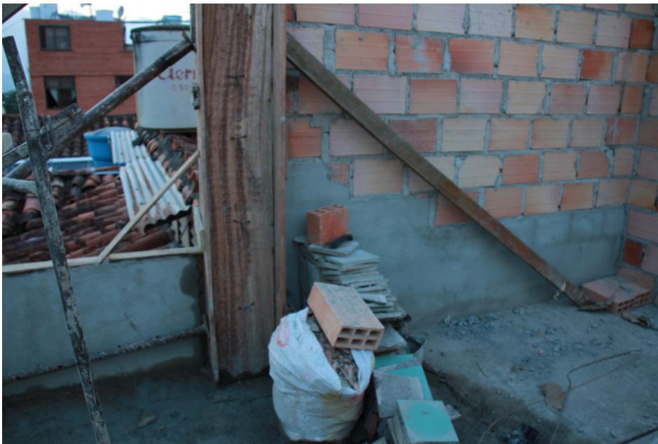
Bild 1 von 2 von Baustoffe Fototitel: Foto Baustoffe 1 Datum: Montag, 24.08.2020 Firma: Leg und Setz GmbH Ausgebaute Zementfliesen gelagert