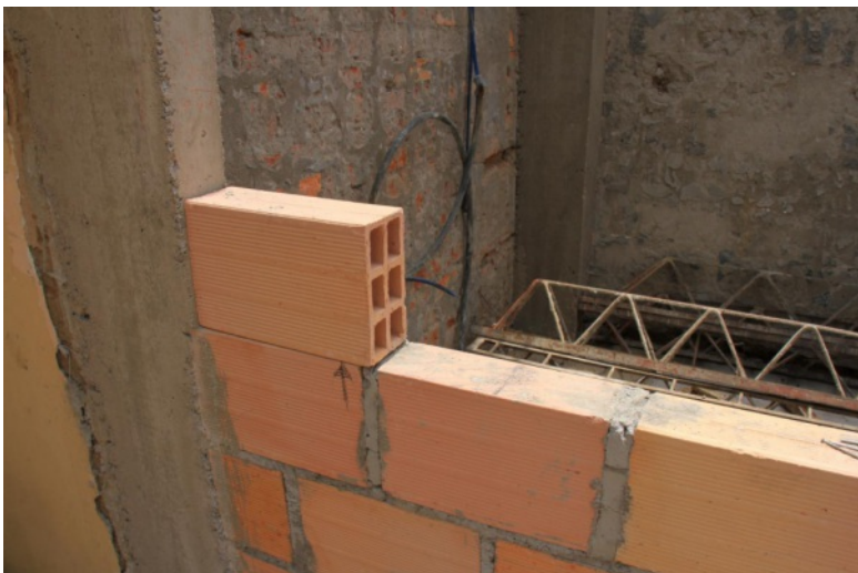
Bild 6 von 10 von Leistungsstand Fototitel: Leistungsstand Foto 6 Datum: Donnerstag, 24.09.2020 Firma: Stein und Bein GmbH Brüstung Küche