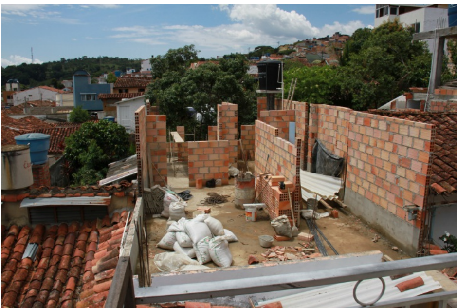
Bild 2 von 2 von Wichtige Baumaßnahmen Fototitel: Baumaßnahmen Foto 2 Datum: Montag, 24.08.2020 Firma: Firmenname 14 Putzarbeiten