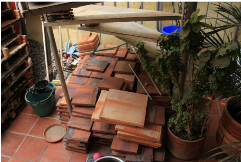
Bild 4 von 10 von Leistungsstand Fototitel: Leistungsstand Foto 4 Datum: Donnerstag, 24.09.2020 Firma: Leg und Setz GmbH Gelagerte Lehmziegel

Erstellt mit dem kostenlosen Bauskript Bautagebuch www.bauskript.de