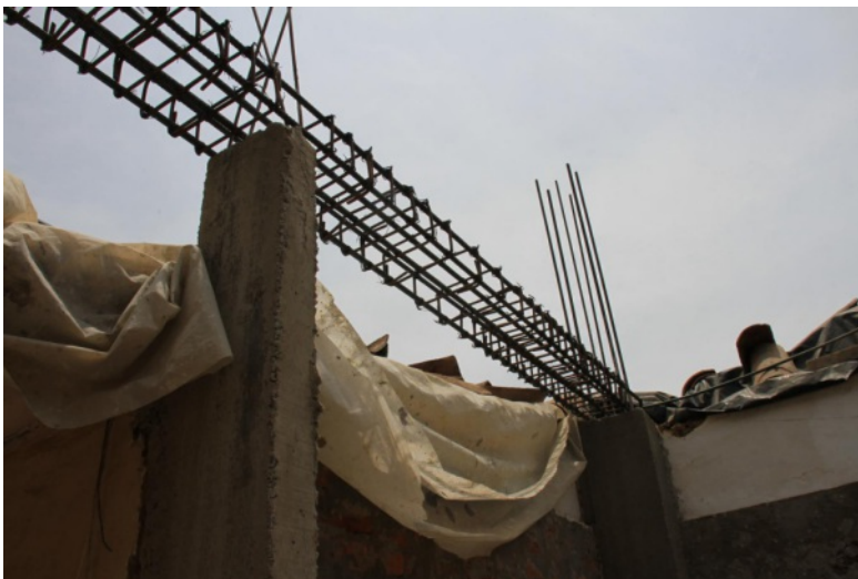
Bild 5 von 10 von Leistungsstand Fototitel: Leistungsstand Foto 5 Datum: Donnerstag, 24.09.2020 Firma: Schütt & Schal GmbH Unterzug über EG