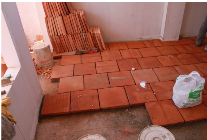
Bild 2 von 3 von Mängel Fliesen nicht plan verlegt, Toleranzen überschritten Fototitel: Mängel Foto 2 Datum: Donnerstag, 24.09.2020 Firma: Kachelmeier GbR