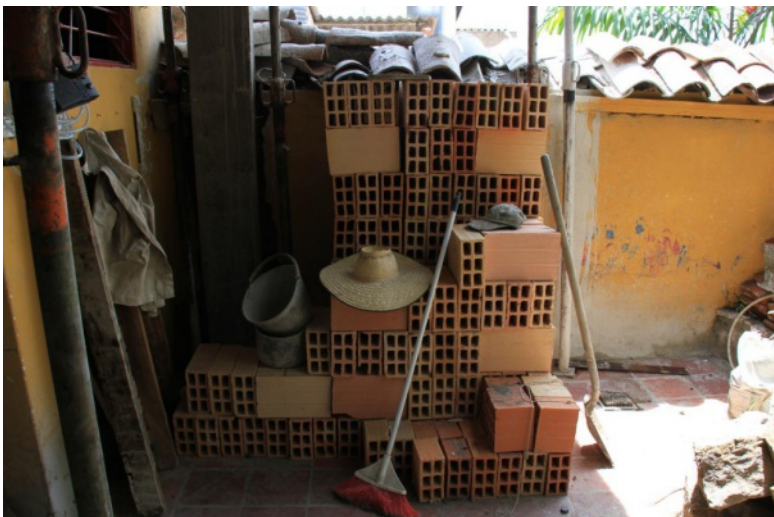
Bild 9 von 10 von Leistungsstand Fototitel: Leistungsstand Foto 9 Datum: Donnerstag, 24.09.2020 Firma: Stein und Bein GmbH H10 gelagert