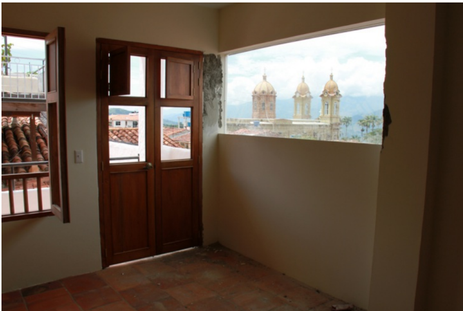
Bild 10 von 10 von Leistungsstand Fototitel: Leistungsstand Foto 10 Datum: Donnerstag, 24.09.2020 Firma: Schnellpinsel GmbH Obergeschoss Restarbeiten

Erstellt mit dem kostenlosen Bauskript Bautagebuch www.bauskript.de